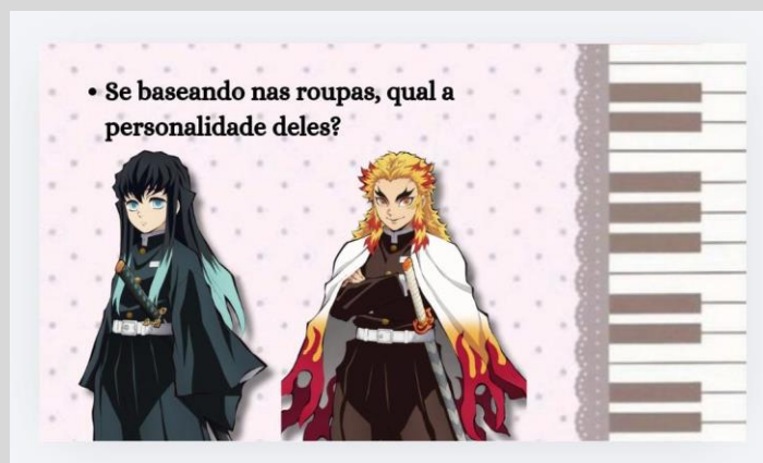
Fig. 01 – Fonte: PowerPoint da autora.

Admito que trouxe os exemplos de Demon Slayer para que eles (também) se interessassem no conteúdo ministrado. A ideia principal era a de fazer uma aula na qual eles gostassem e tivessem liberdade para colocar resquícios da imaginação deles em uma folha de papel. Adianto que funcionou, porém, dissertarei melhor na seção de resultados.