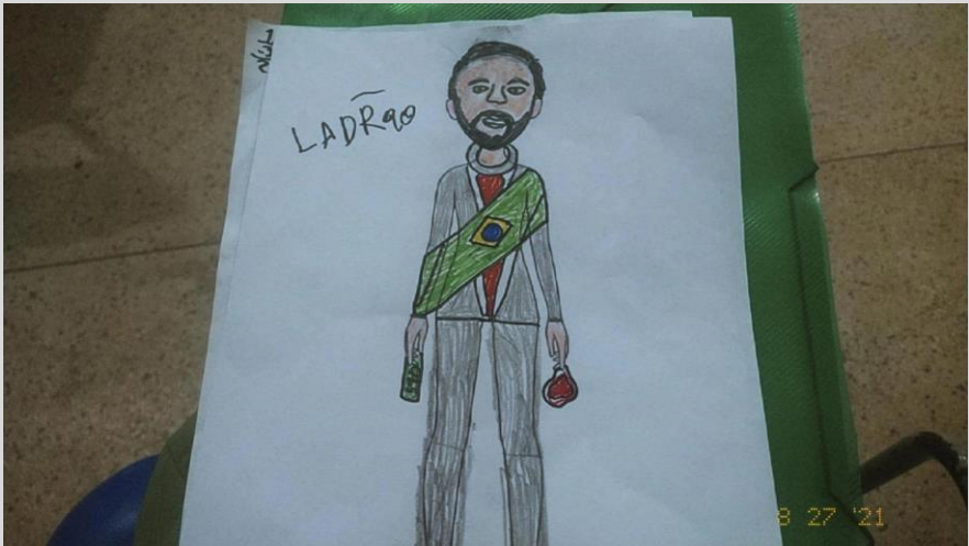
Fig. 04 – Fonte: Desenho feito por um aluno da turma 603

A princípio, minha primeira reação foi o choque. Por não ter mencionado explicitamente os aspectos políticos que um figurino pode carregar, a arte produzida por aquele aluno me intrigou a ponto de muitos questionamentos (que estavam sem respostas, até então) surgirem em mente.