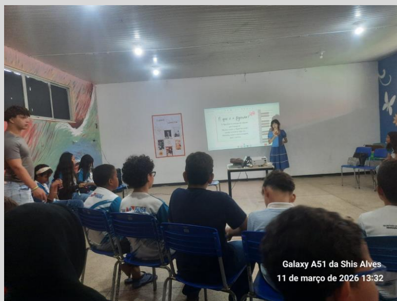
Fig. 02

A mesma estrutura de aula e a mesma atividade foram passadas para três turmas diferentes. Como primeiro resultado observado, há a recepção das turmas. Apesar de todos estarem na mesma faixa etária, cada turma se comportou e adequou a dinâmica passada de uma forma diferente.