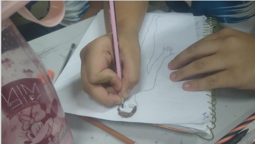
Fig. 03